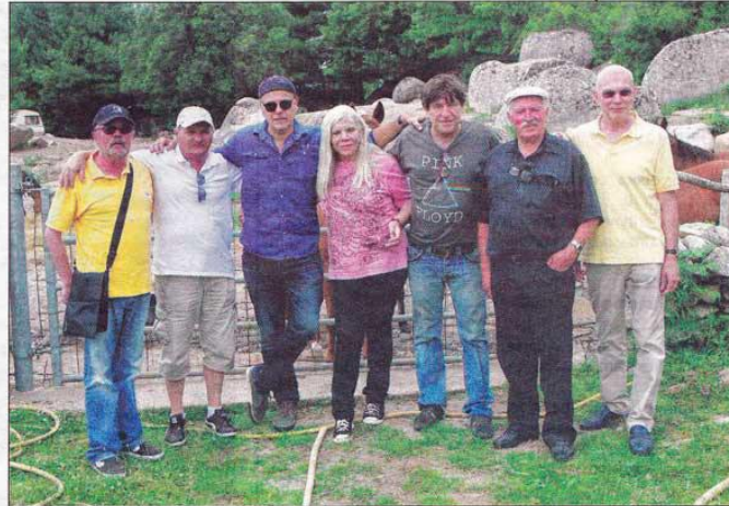
Les membres du jury au gîte de montagne « Chez Pierrot ».

Tel sculpteur aurait plus mérité d'être récompensé, ou tel autre,