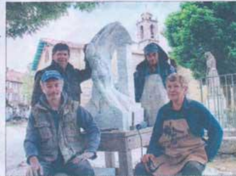
Les quatre sculpteurs accueillent le public avec plaisir pour faire découvrir leur art.

Granite-Marbre-Fer : voici donc la matière première, que les organisateurs ont mise à disposition des artistes. Deux blocs de granite, pesant à l'origine chacun plus d'une tonne, proviennent du barrage du Rizzanese, comme la ferraille. Le bloc de marbre a voyagé un peu plus... Depuis la fameuse carrière de Carrare en Italie, il pèse à l'origine près de 900 kg.