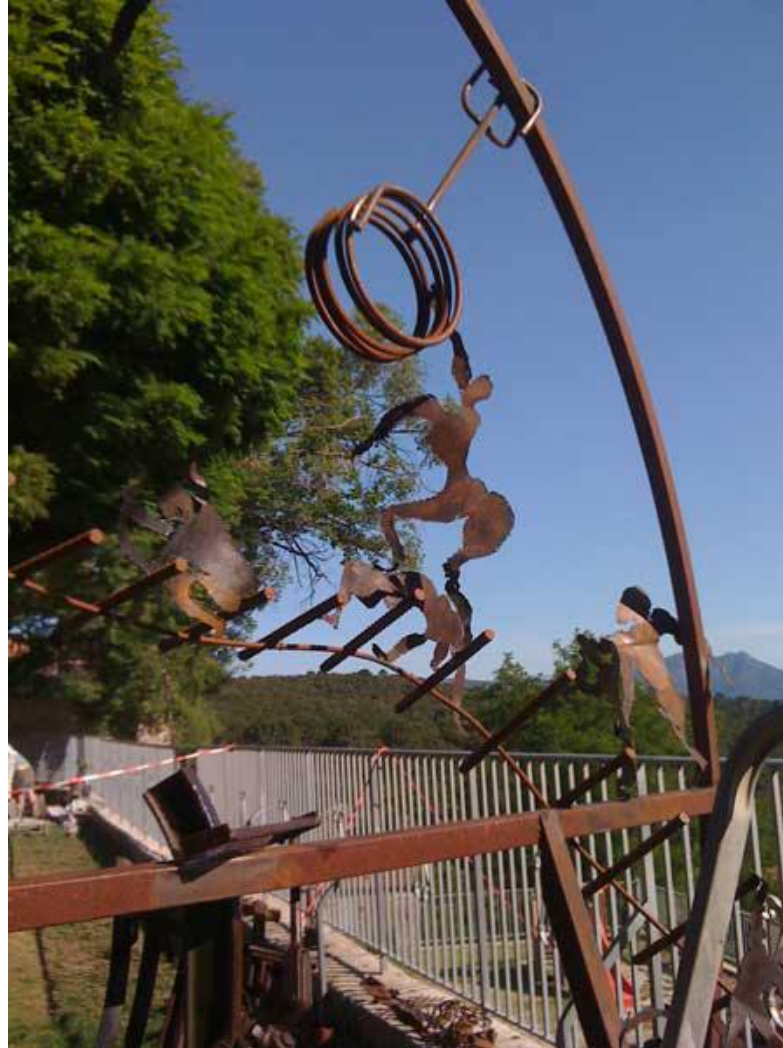
Les personnages qui luttent contre leur destin, découpés au chalumeau à plasma se mettent en place