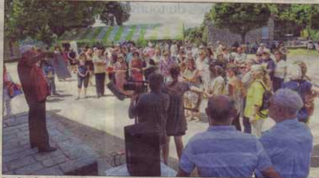
Pendant le discours du lancement de la biennale 2013.

À noter la présence enthousiaste du président de l'Assemblée de Corse, Dominique Bucchini, qui fit le tour de l'exposition et discuta avec l'ensemble des sculpteurs.