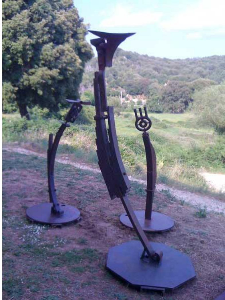
Les trois juges ; Au premier plan le juge abstrait, comme la statue du commandeur