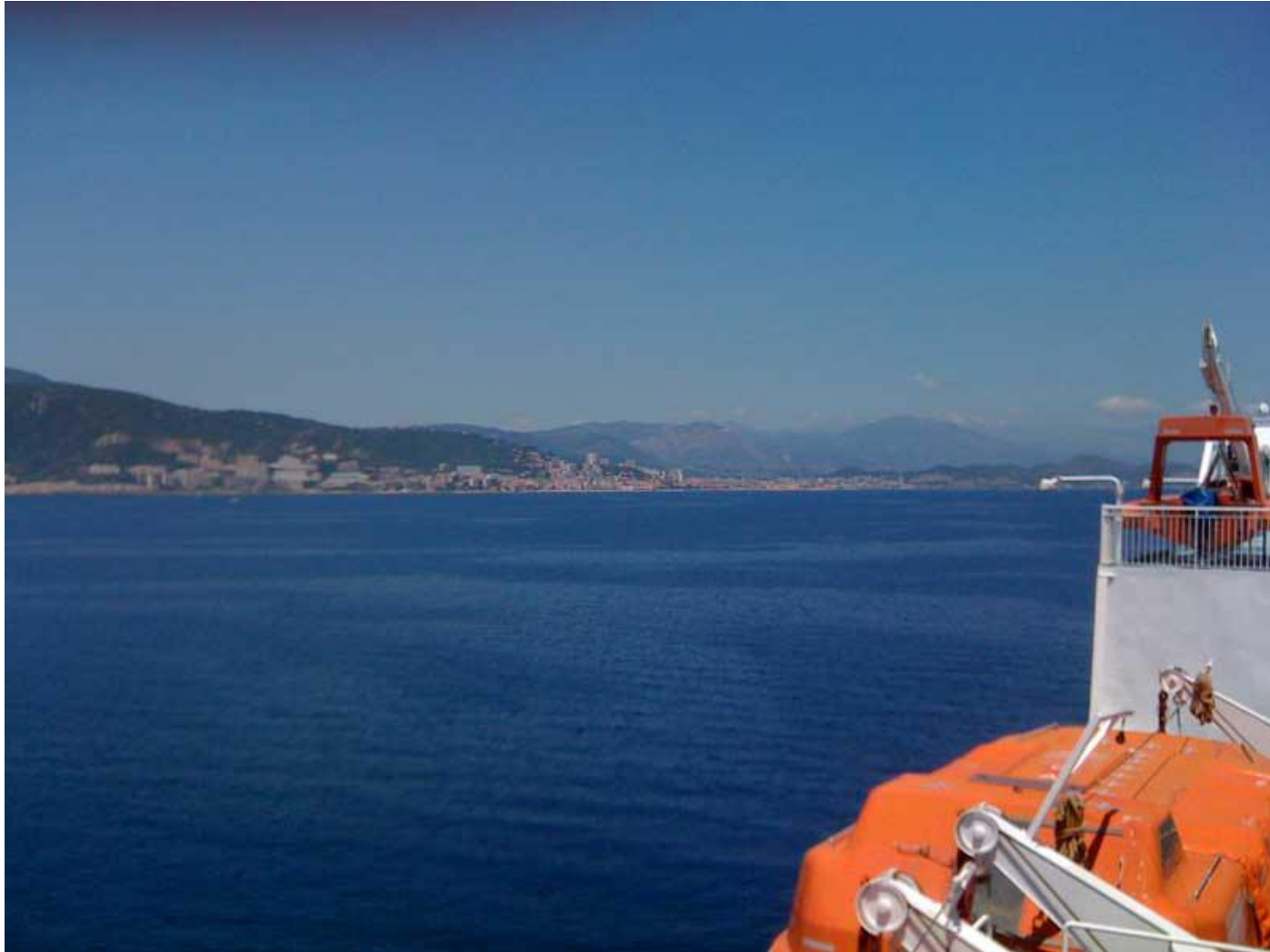
Arrivée à Ajaccio