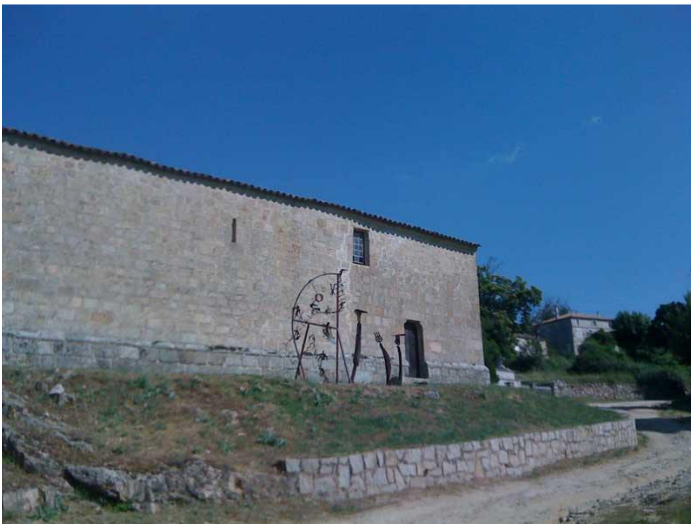
Avant le positionnement des trois juges