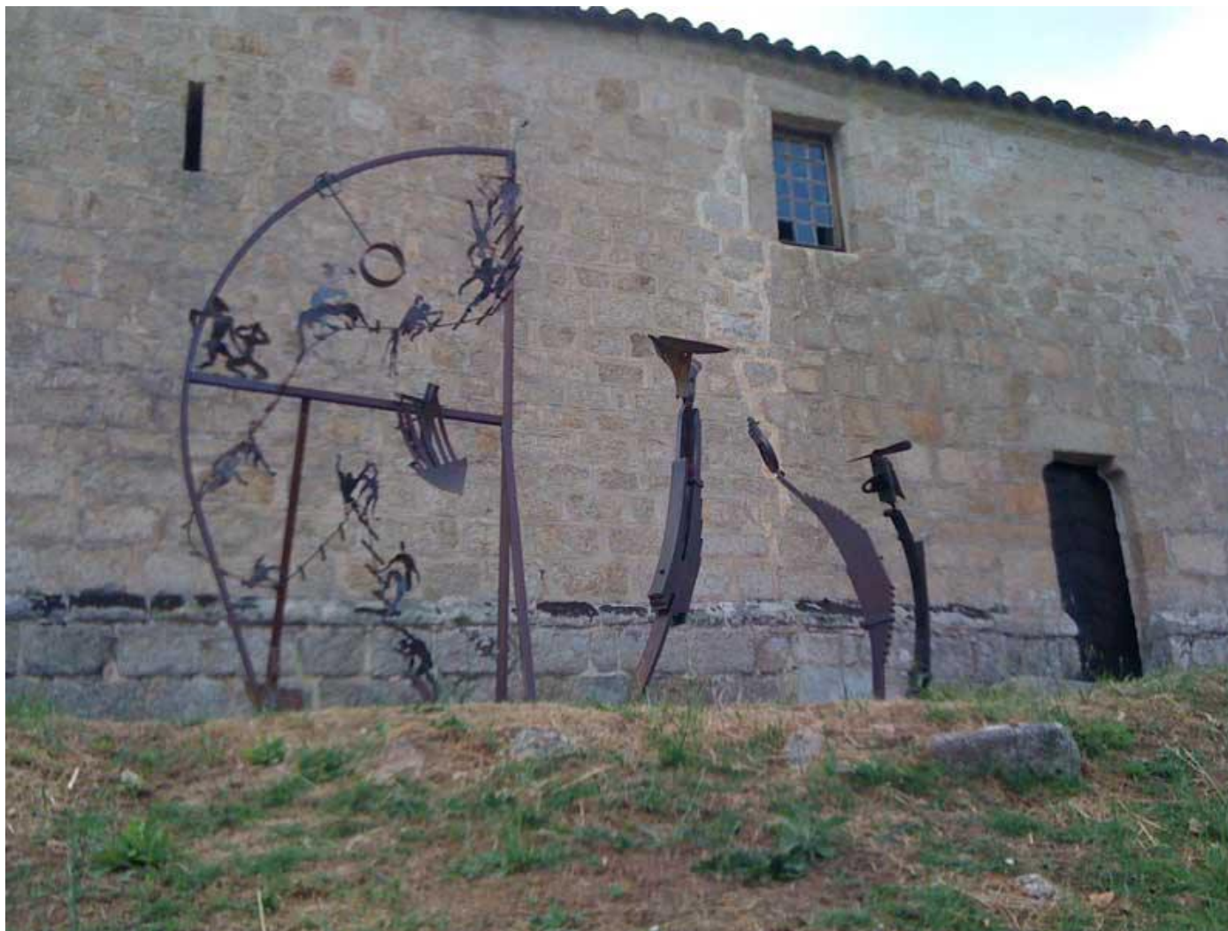
La descente aux En-fers et les trois juges (affectif, concret et abstrait) devant le mur de la chapelle romane du XIe siècle