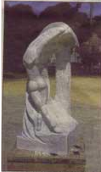
Une Manon des sources corses, éclatante...

Infos pratiques : Programme 2013 détaillé sur www.biennale-altarocca.com/ Contact : 04.95.78.68.69