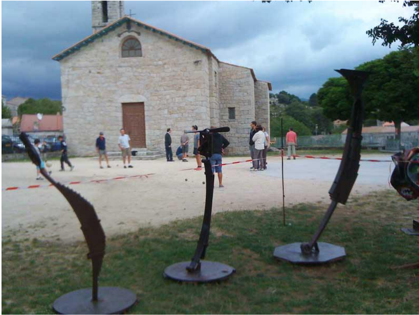
La place de l'église et la partie de boules. Les trois juges de la descente aux En-fers sont enfin debout et soudés