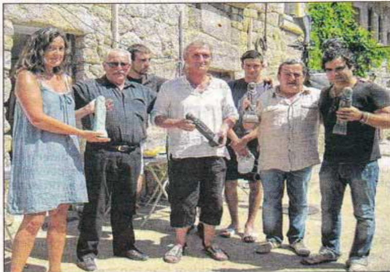
La 4 e édition de la biennale de Quenza s'est achevée avec la remise des prix du vote du public et un concours de boules.

Le jeune garçon doit en effet recevoir une greffe de rein prochainement. La somme de 2 200 euros a été collectée et remise sous forme de chèque par l'association Fiore di Petra aux parents, qui ont remercié chaleureusement les organisateurs ainsi que toutes les personnes qui ont fait un don et participé au concours.