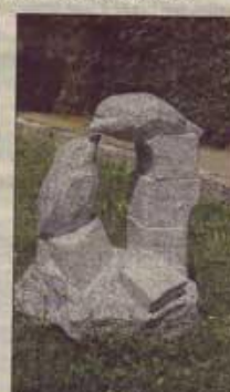
Les oiseaux de Rob se bécotent enfin dans le village.

Inauguration en présence du président de l'Assemblée territoriale de Corse