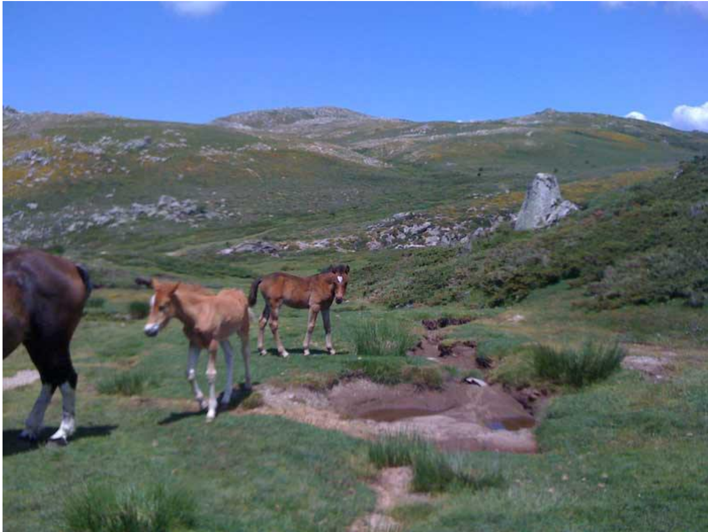
Interlude sur le plateau du Coscione avec les chevaux sauvages