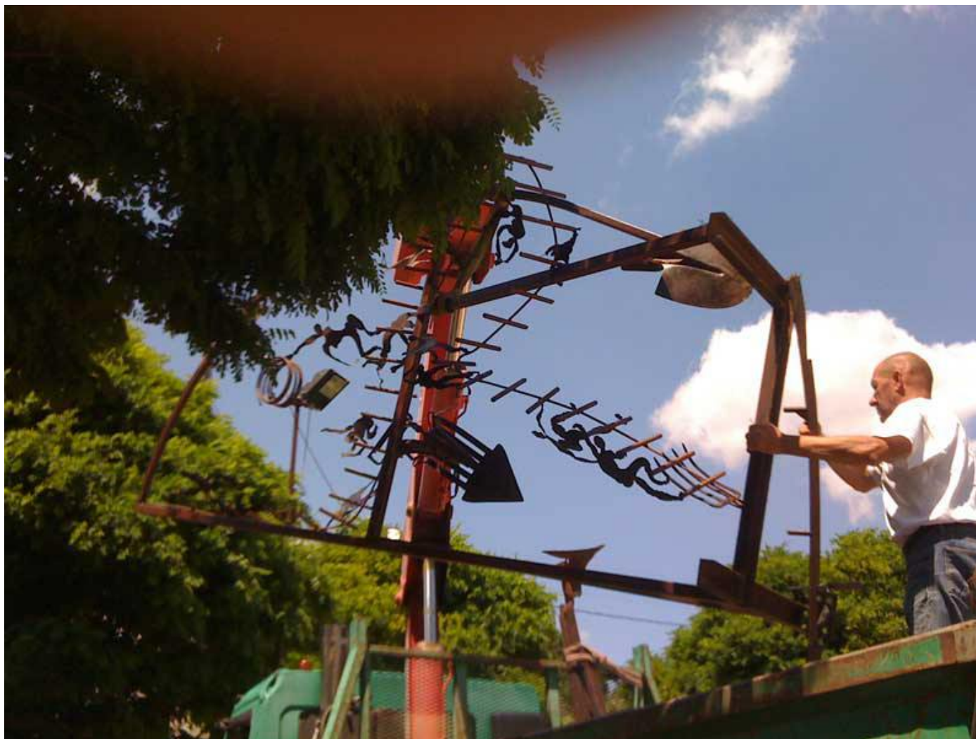
Le transport de la descente aux en-fers vers leur destination finale avec un engin élévateur