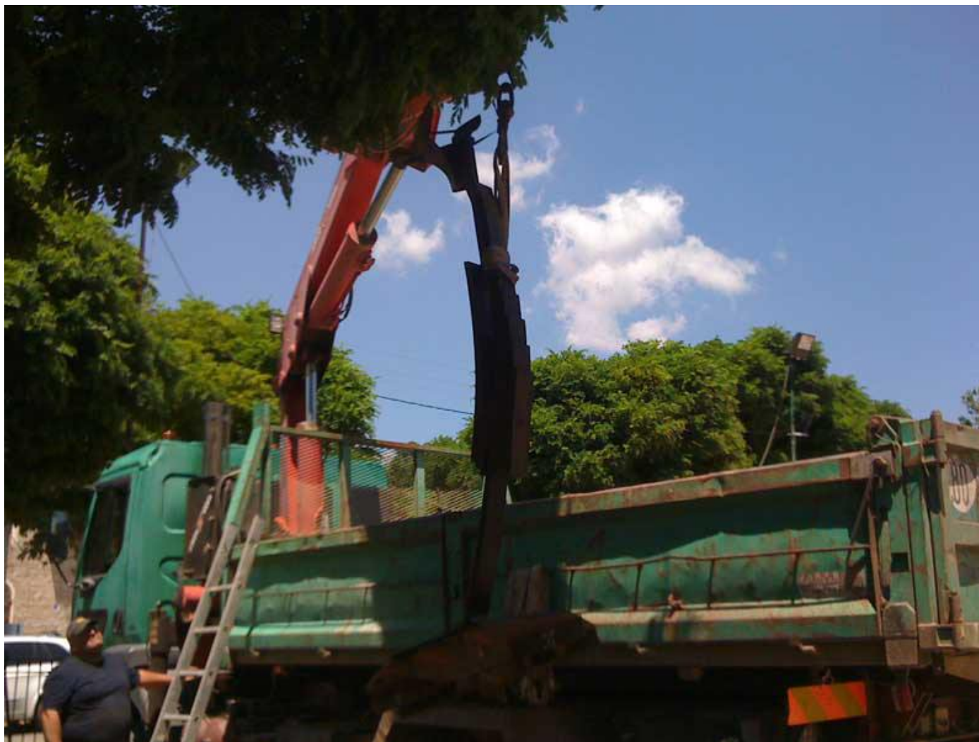
Le transport des quatre éléments de la sculpture vers leur destination finale avec un engin élévateur