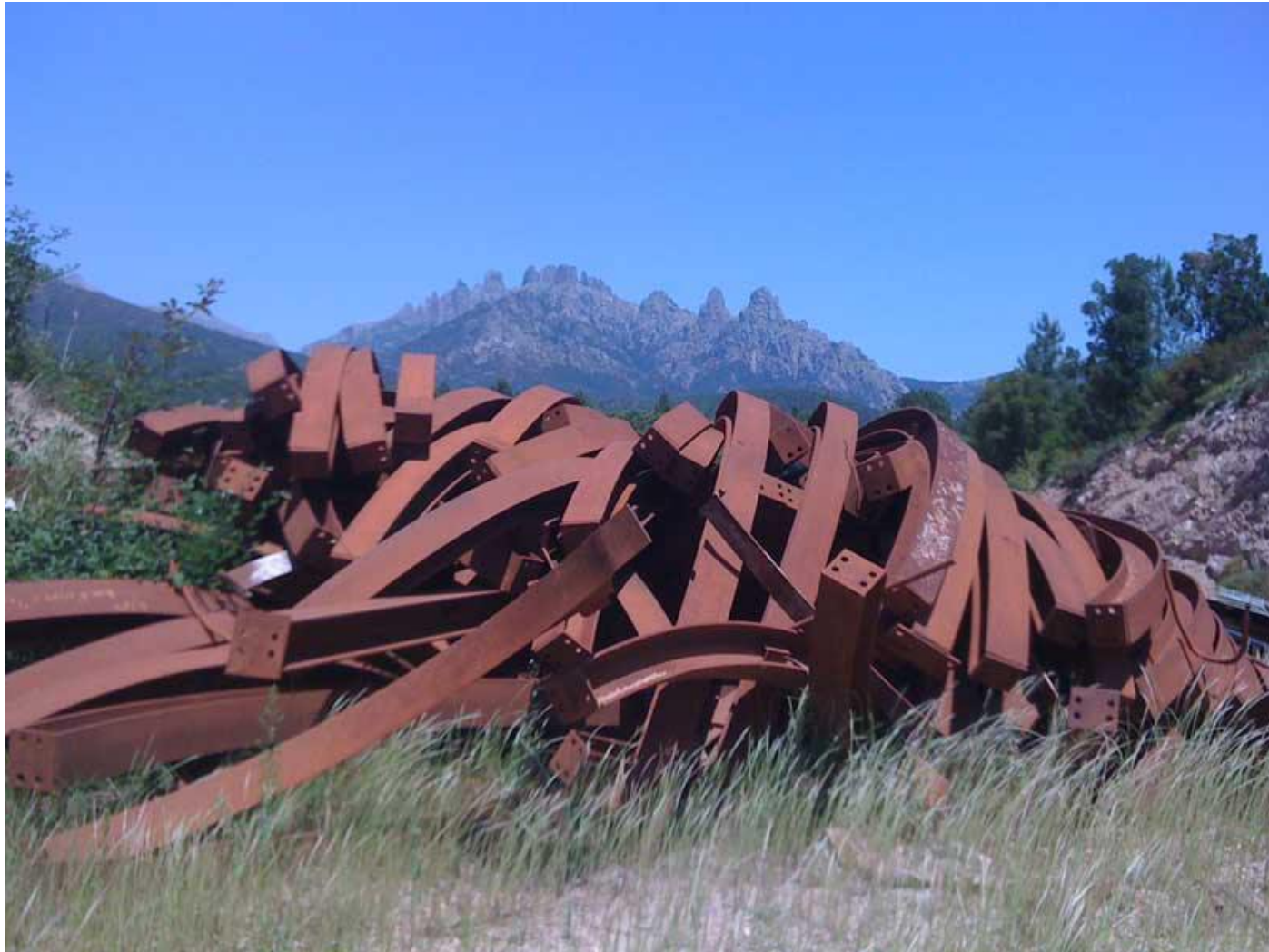
La plus belle sculpture de la biennale : Installation éphémère au pied des aiguilles de Bavella